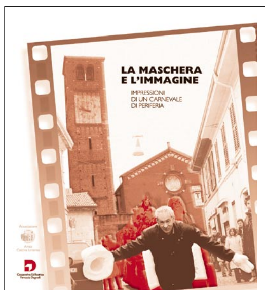
La Maschera e l'Immagine libro fotografico di Renato Bosoni in collaborazione con Associazione Amici Cascina Linterno