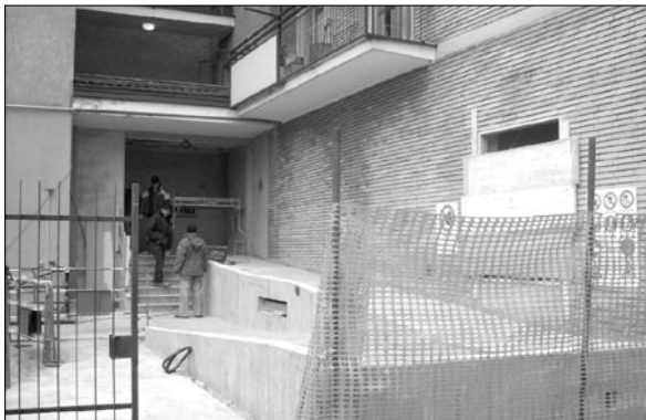
Rampa disabili di Via F.lli Zanzottera 14

Proseguono secondo le previsioni i lavori di ristrutturazione del salone-teatro di Via F.lli Zoia 89 e dello spazio sociale di Via F.lli Zanzottera a Figino; la rampa disabili di Via F.lli Zanzottera 14 sta per essere ultimata.