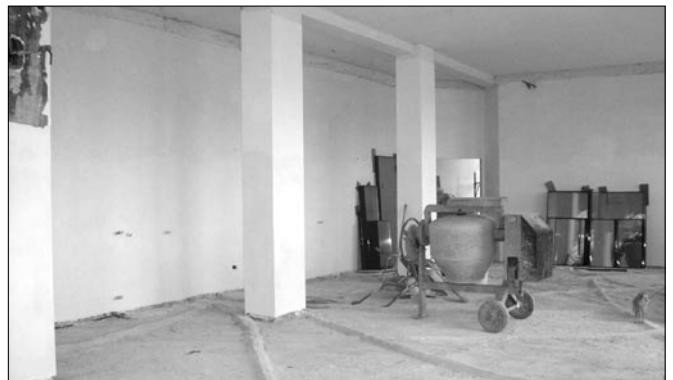
Spazio Sociale Via F.lli Zanzottera - Figino

E' stata stipulata una convenzione tra La Cooperativa Edificatrice Ferruccio Degradi e l'hair stylist