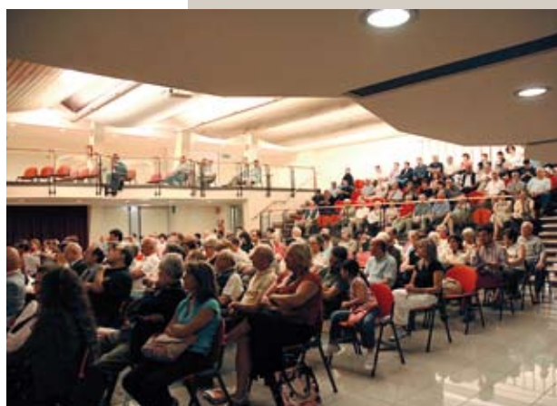
Alcuni momenti dell'Assemblea del 28 Giugno scorso