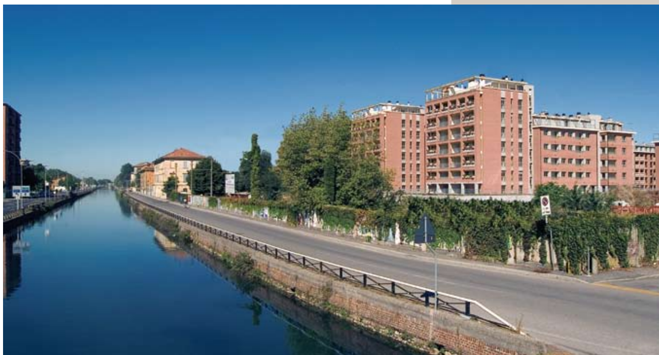
Un'immagine dell'area dell'Ex Cartiera Burgo