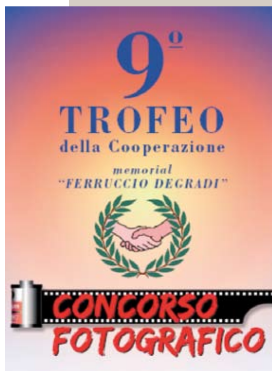
La locandina del Concorso Fotografico

Per ulteriori informazioni ci si può rivolgere presso gli uffici della Cooperativa o telefonare al n. 3382271849.