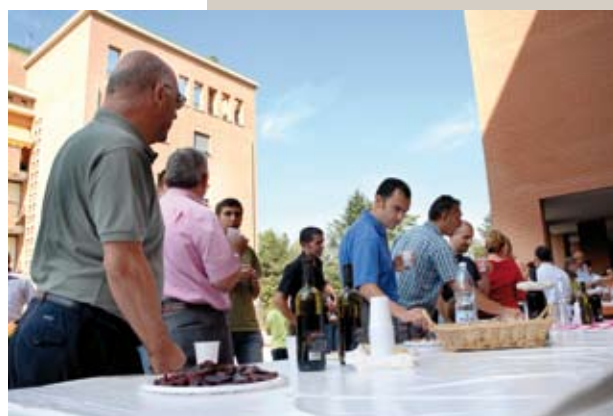
Alcuni momenti della festa di inaugurazione