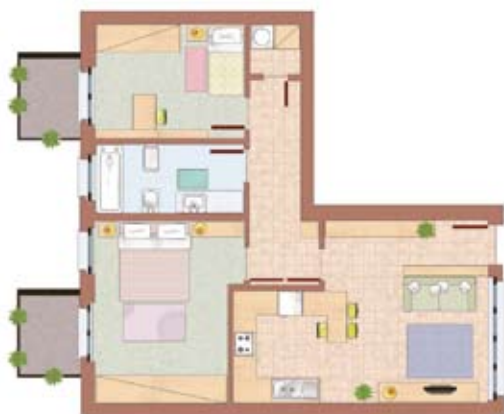
esempio di trilocale