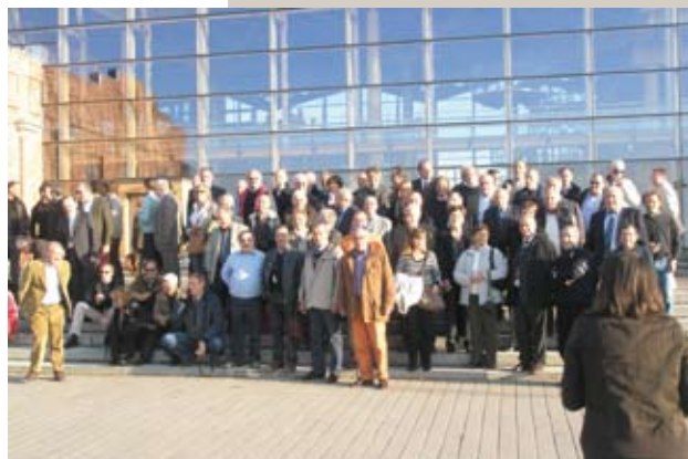
La delegazione A.N.C.Ab. in Finlandia

Un viaggio estremamente interessante e coinvolgente che ha saputo, seppure in un brevissimo arco di tempo, fornirci una ampia e dettagliata visione delle problematiche riguardanti il problema casa.