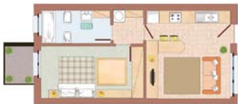
esempio di bilocale