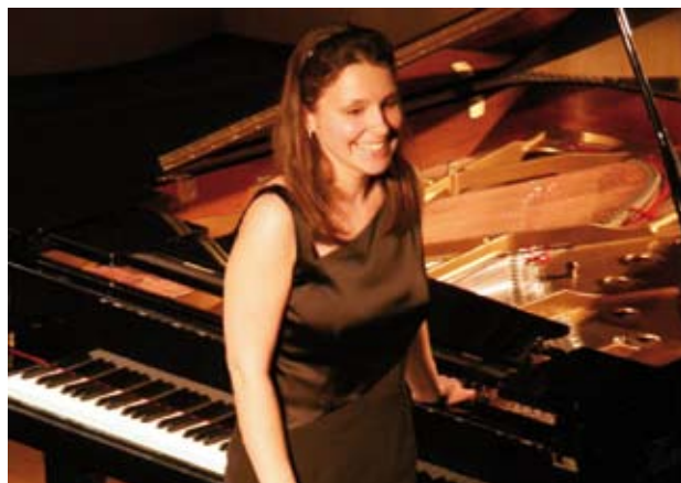
Alcune immagini scattate durante la Rassegna 2007/2008