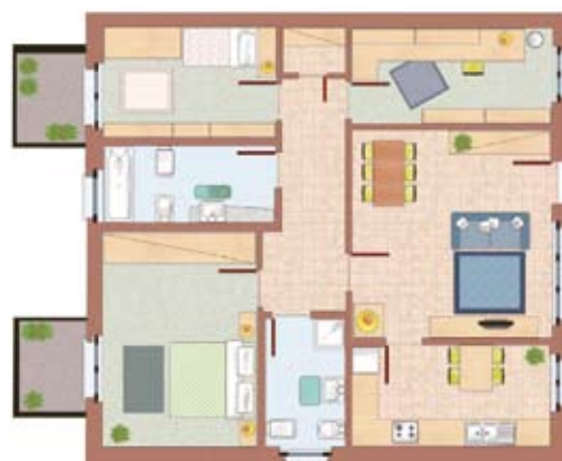
esempio di quadrilocale